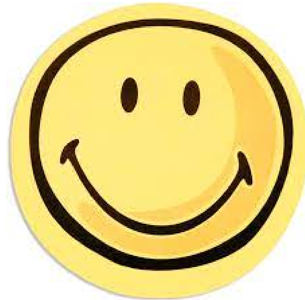
Abb. 10: positiv