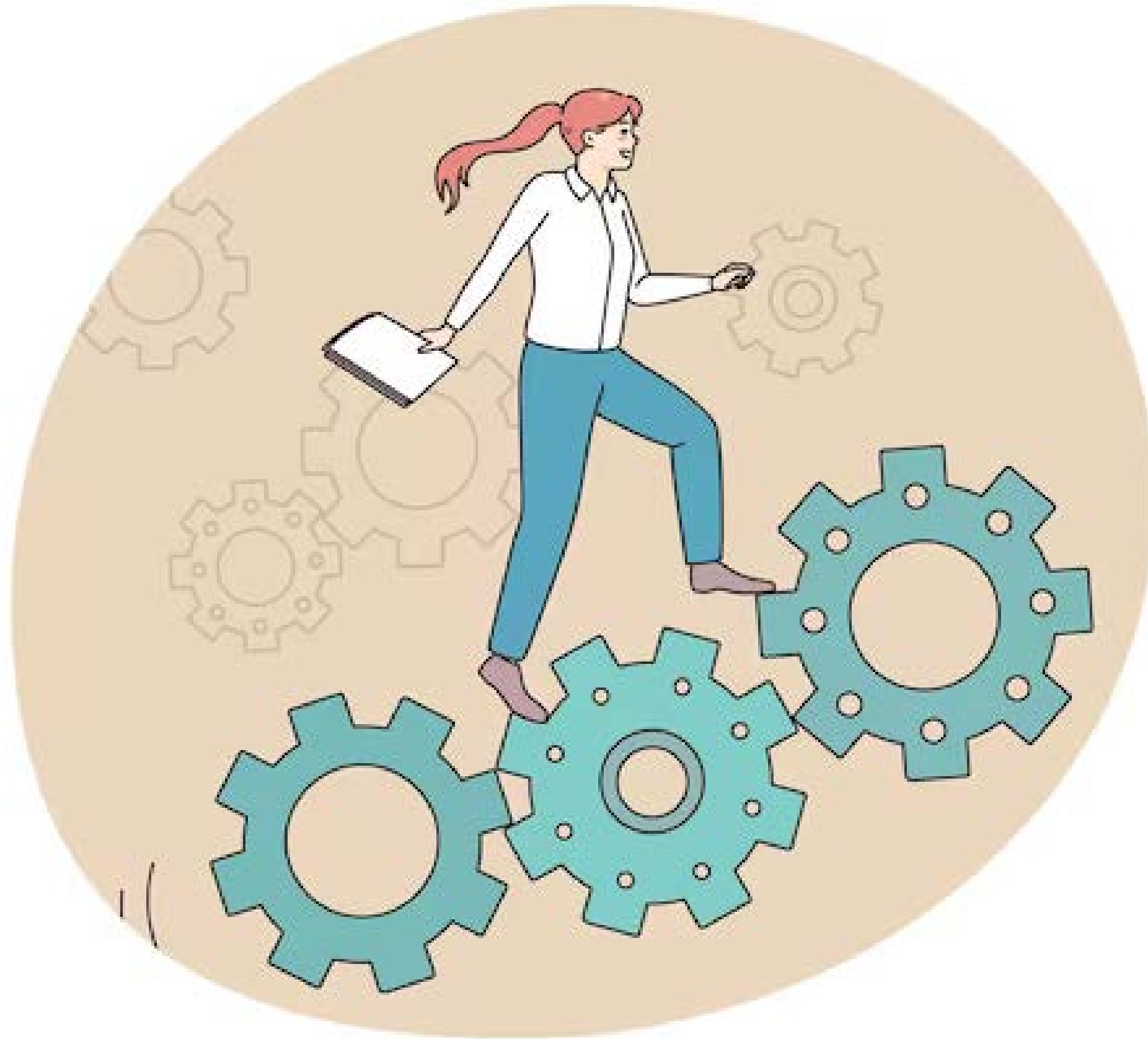
Abb. 8: Gelingen