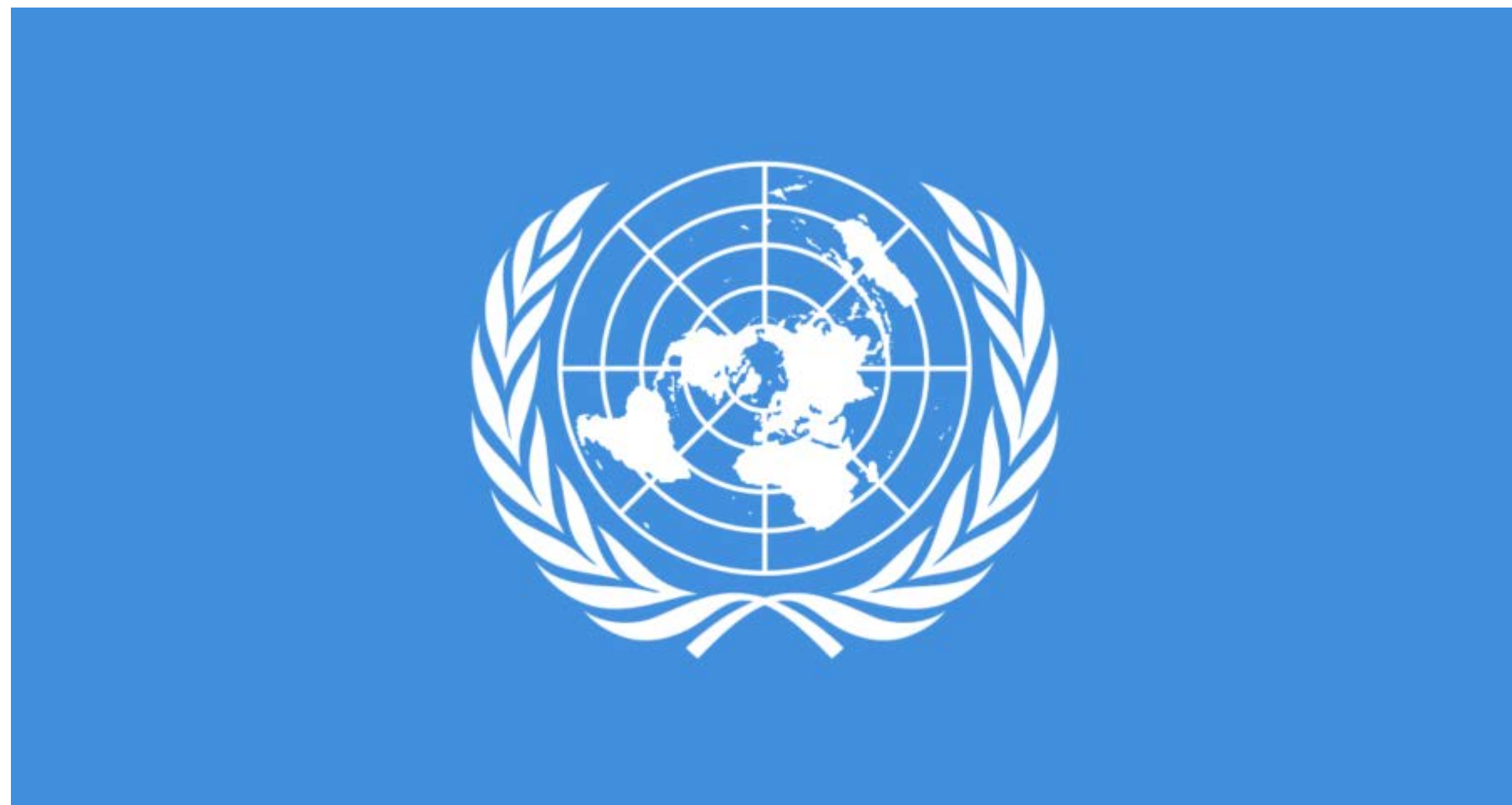
Abb. 6: UN-Behindertenrechtskonvention 2006

Ratifizierung UN-Behindertenrechtskonvention 2014