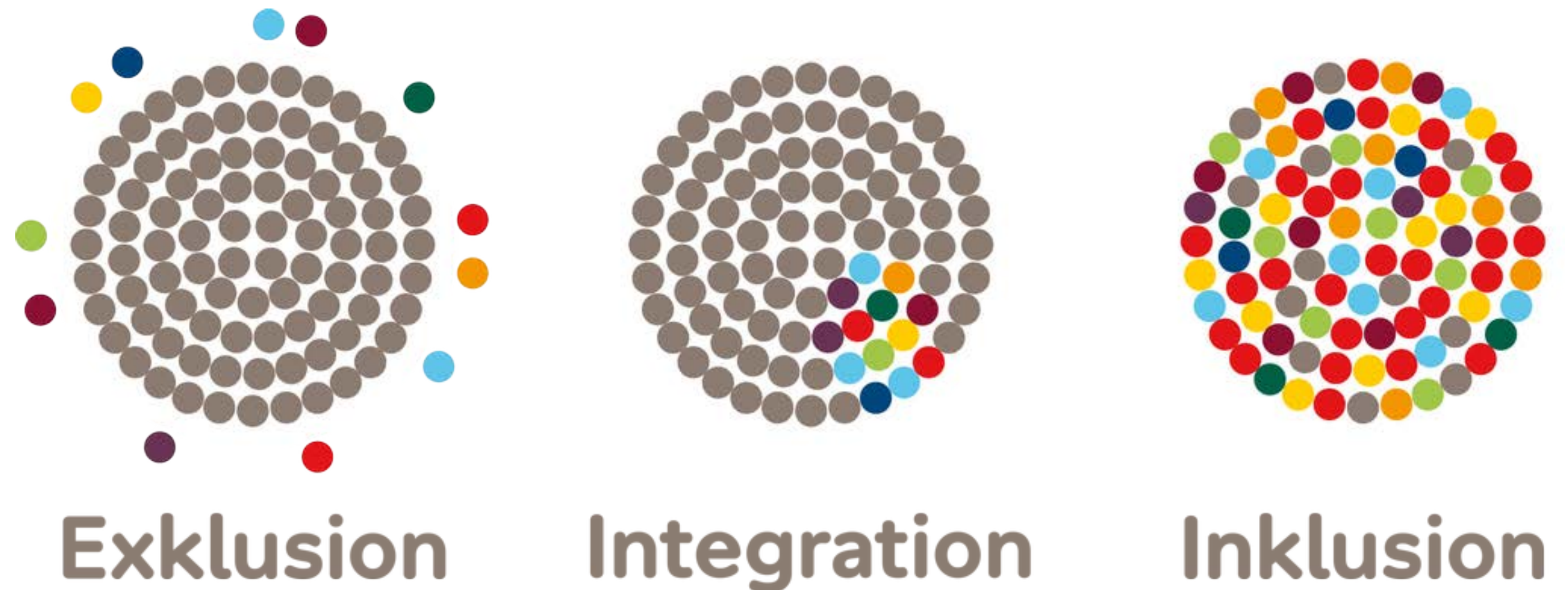
Abb. 4: Gemeinsam verschieden sein

Ziel der Inklusion ist Umsetzung des Rechtes aller Menschen auf Teilhabe und Teilgabe, Selbstbestimmung und Bildung (Heimlich 2019)