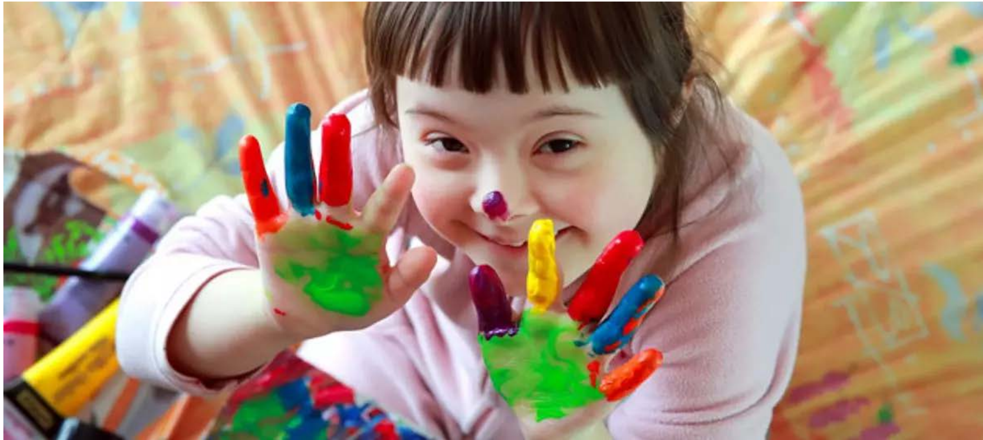
Abb. 3: Kinder mit Behinderung