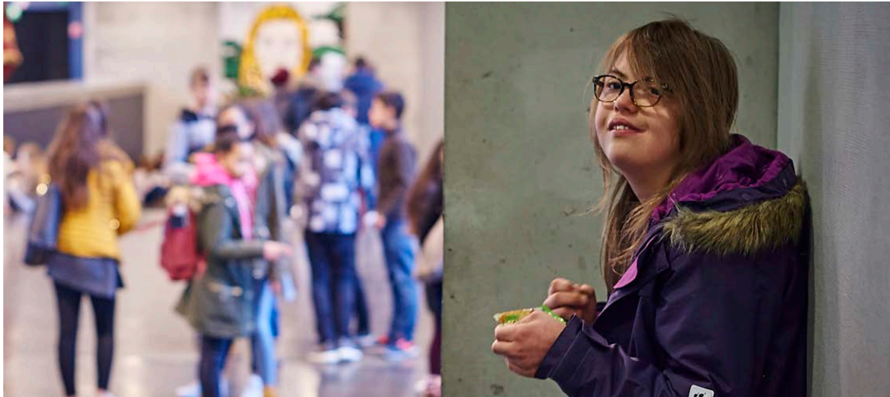
Abb. 1: Inklusion in der Schule

Jedes Kind mit einer Behinderung oder Lernstörung hat in der Schweiz grundsätzlich Anspruch auf Unterricht in einer Regelschule.