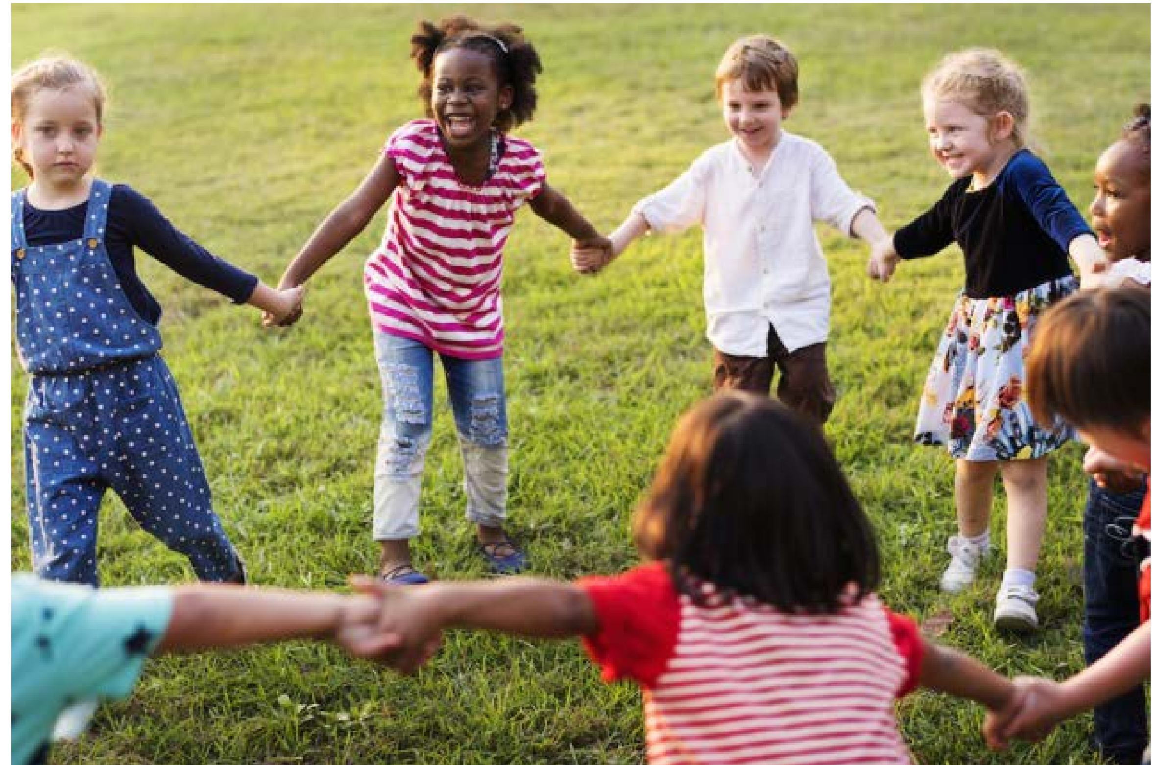
Abb. 5: Le chef d'orchestre