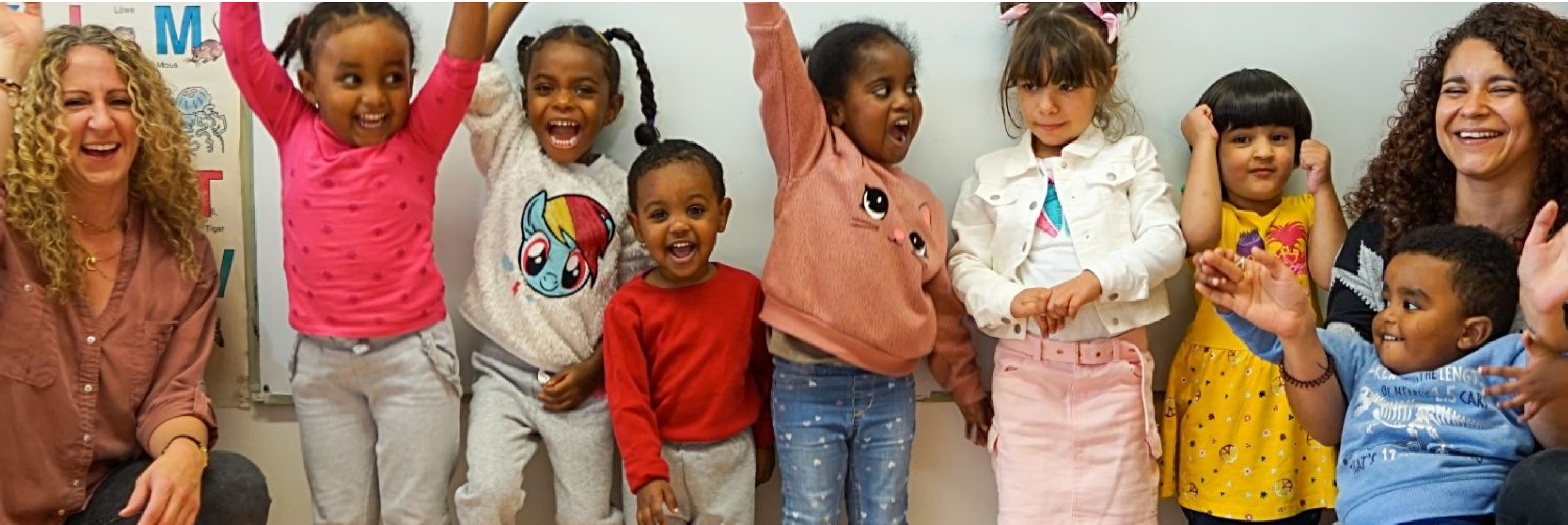
Abb. 2: Kita und Vielfalt